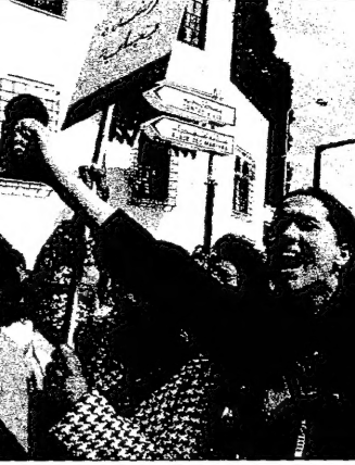
من المقرر ان يصادق البرلمان على قانون العائلة ومالين بالقتل (رويتز)

وقال الصادق المهدي في مقابلة مع صحيفة "الشرق الأوسط" ان نظام الخرطوم يحاول تجميل صورته من خلال الدستور الجديد بعد ان فشل سياسيا واقتصاديا وعسكريا. وقال الصادق المهدي في مقابلة مع صحيفة "الشرق الأوسط" ان نظام الخرطوم يحاول تجميل صورته من خلال الدستور الجديد بعد ان فشل سياسيا واقتصاديا وعسكريا.